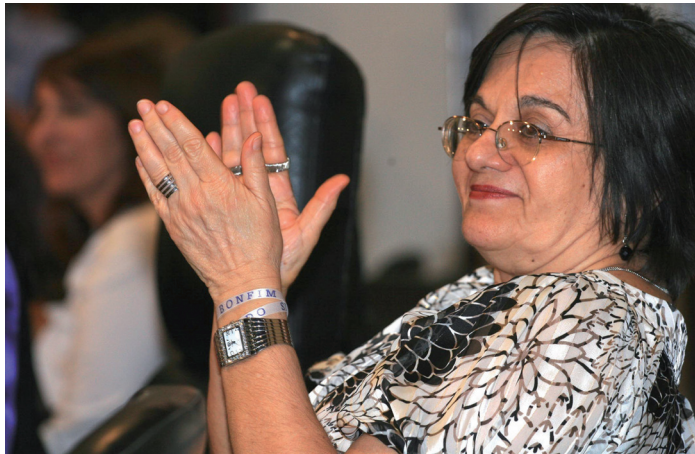
Maria da Penha: sua história inspirou a criação da lei 11.340/06

Na verdade, a Lei Maria da Penha é muito mais do que isso . Ela é um avanço, pois além de trazer medidas de punição prevê também ações públicas para prevenir a violência doméstica e ampliar a proteção à vítima.